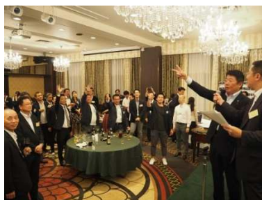
<抽選会・じゃんけん大会>