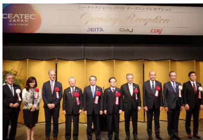
<レセプション風景>

これまで「最先端 IT・エレクトロニクス総合展」として開催してきた CEATEC JAPAN は、2016 年より「CPS/IoT でつながりが深まる社会、新たにもたらされる未来を共に創り出す場」をテーマに「CPS/IoT Exhibition」へと生まれ変わりました。CSAJ では、特別展示やカンファレンスなども企画運営しています。