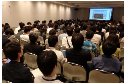
<CSAJ 企画カンファレンス会場>

CSAJ 会員は、会員特別価格で出展することができます。約 15 万人の来場者へのプロモーションに活用いただけます。