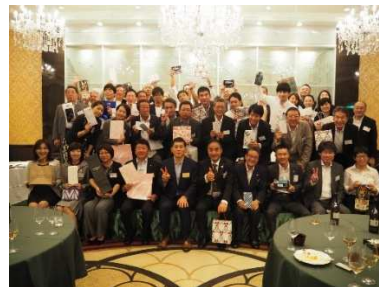
<豪華賞品をゲットした皆様>

CSAJ 理事や会員企業参加者との名刺交換で人脈を拡大。豪華景品を提供して自社をアピール(じゃんけん大会に参加することもできます)。参加して豪華賞品をゲット!・・・など楽しさも盛りだくさんです。