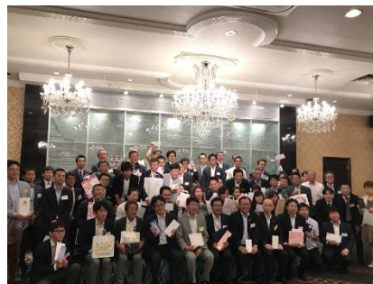
<豪華賞品をゲットした皆様>

CSAJ 理事や会員企業参加者との名刺交換で人脈を拡大。豪華景品を提供して自社をアピール(じゃんけん大会に参加することもできます)。参加して豪華賞品をゲット!・・・など楽しさも盛りだくさんです。