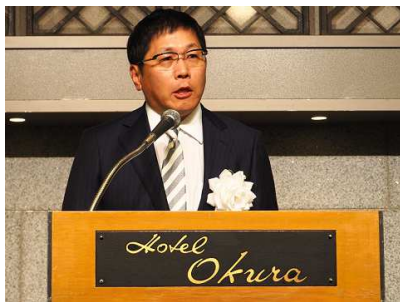
<萩原会長の開会挨拶>

総会終了後には、関係省庁・団体などからも広くご来賓をお招きした立食パーティが開催され、約450人の皆様が参加されています。