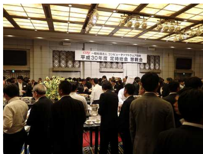
<会場内の懇談の様子>